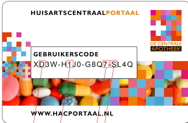
Uw HAC pas